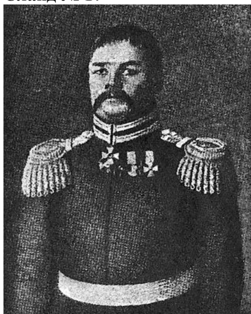
Генераль-лейтенантъ И. Е. Ефремовъ.

Педагог: Скажите, ребята, с каким героем мы с вами сегодня познакомились?